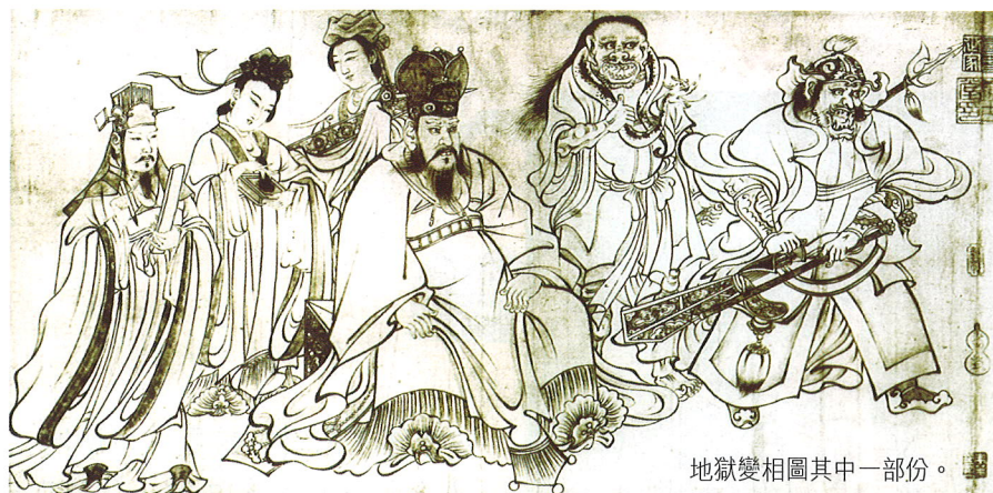
地獄變相圖其中一部份。

小心地把畫貼在紡織機前的牆壁上。當天晚上，外面天色漸黑，婆婆才發現那幅畫原來是一片藍天，天上有無數閃亮的星星，眾星之間有一個圓大皎潔的月亮，月光把屋內照亮了。此後，每天晚上，畫中的星星和月亮都會發出光輝，照着婆婆紡紗線。 ㊦